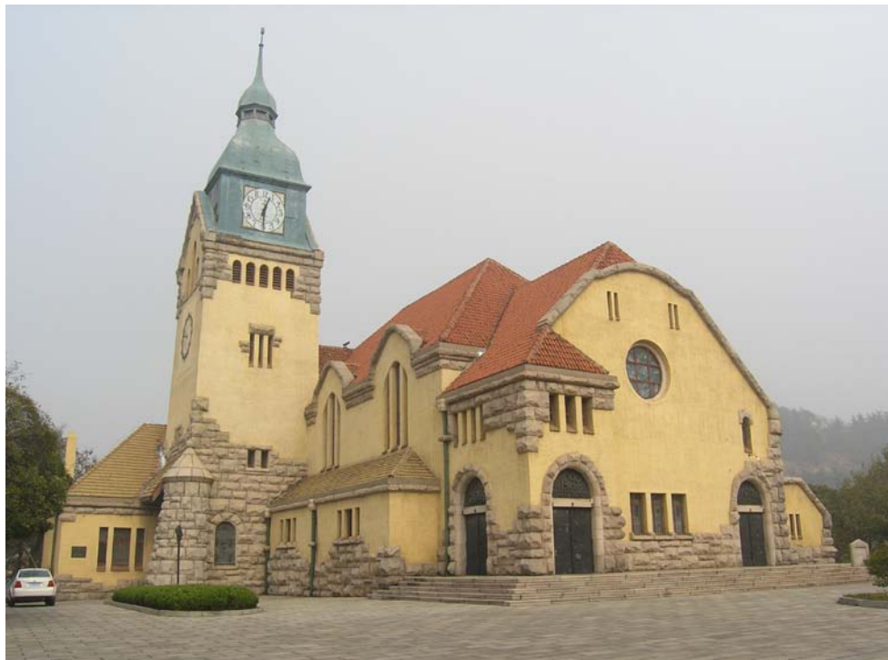
Tsingtau (Qingdao) : Evangelische Christus-Kirche (1908-1910)