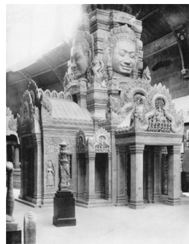
Gipsabguss-Werkstatt von Angkor im Musée Albert Sarraut in Phnom Penh, nach 1920 (links) und ein hybrider Tempelnachbau im Musée indo-chinois in Pariser Palais du Trocadéro , nach 1900 (rechts)